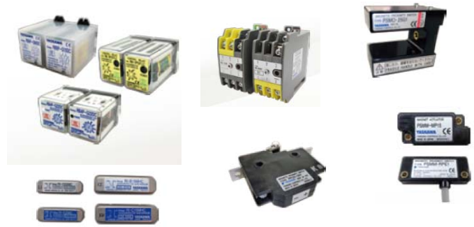
ベスタクト内蔵製品